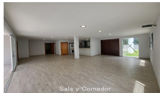
Sala y Comedor