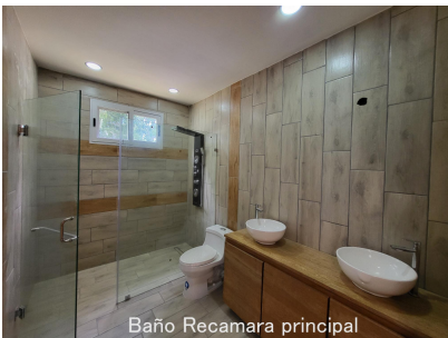
Baño Recamara principal