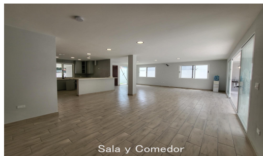
Sala y Comedor