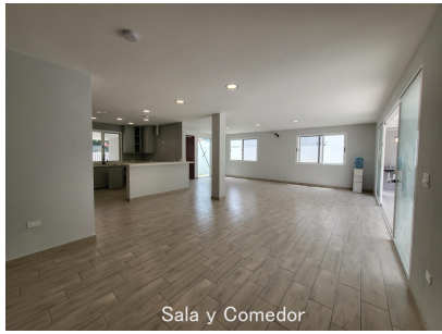
Sala y Comedor