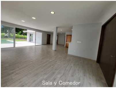
Sala y Comedor