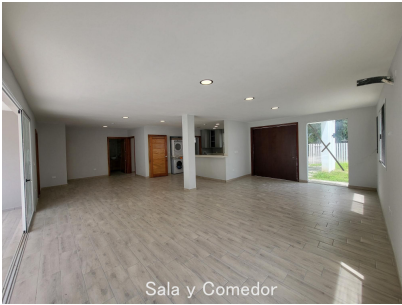
Sala y Comedor