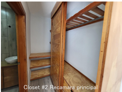
Closet #2 Recamara principal