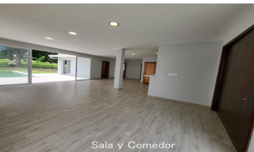
Sala y Comedor