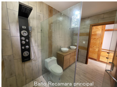
Baño Recamara principal