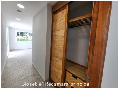
Closet #1 Recamara principal