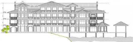
ELEVACION LAT. DERECHA